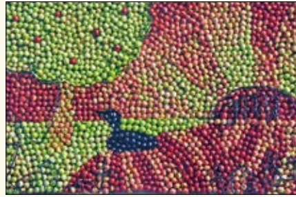
Årets Epletaule, den 10. i rekka, laget av linja for kreativ design på Sagavoll folkehøgskole.