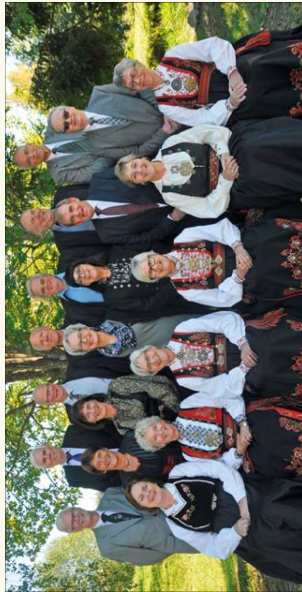
50 års jubilarer, konfirmerert i Nes kyrkje 23. mai 1965.