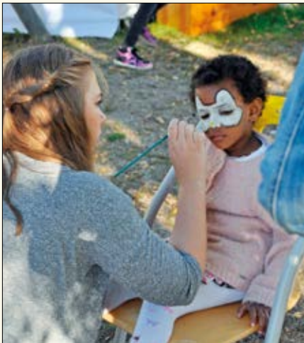
Ansiktsmaling er populært.