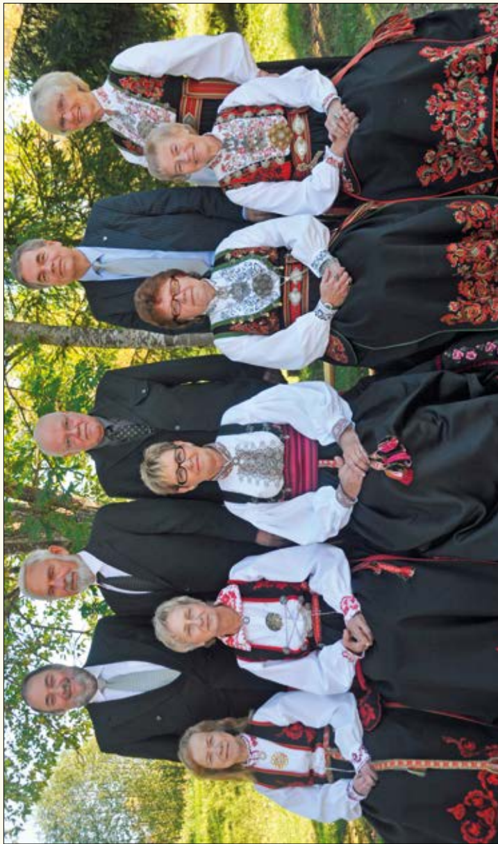
50 års jubilarer, konfirmanter i Sauherad kirke 25. april 1965.

Samlet til jubileum søndag 27. september 2015