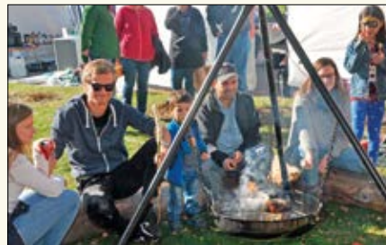
I barnekroken kunne man både grille pølser og steike pinnebrød.