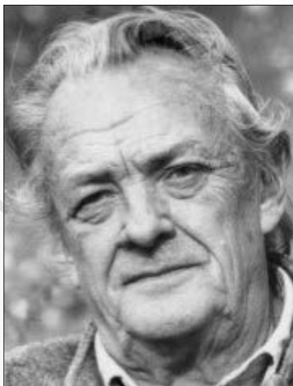
Erik Bye. (1926 – 2004). Norsk fjernsynspersonlighet, dikter, sanger og journalist.

«Blå salme» er salme til styrke når vi kjenner livet krevende på vår hjemmebane, men kanskje like mye i møte med de store utfordringer vi møter hver dag: Flyktingsituasjonen som nå møter oss i Europa kan gjøre at vi tror at vi må gi opp. Klimautfordringene og det framtidssamfunnet vi etterlater til kommende slekter, kan gjøre at vi mister gnisten i livet. Og ikke minst sjøloppattheten som gjør at vi bare byr oss om det nære og oss sjøl. Så kommer salmen med oppfordringen om å «Gå inn i Herrens tid» - i møte med disse utfordringene, og samtidig takke for det som blei oss til del. Jeg synger fortsatt på Blå salme.