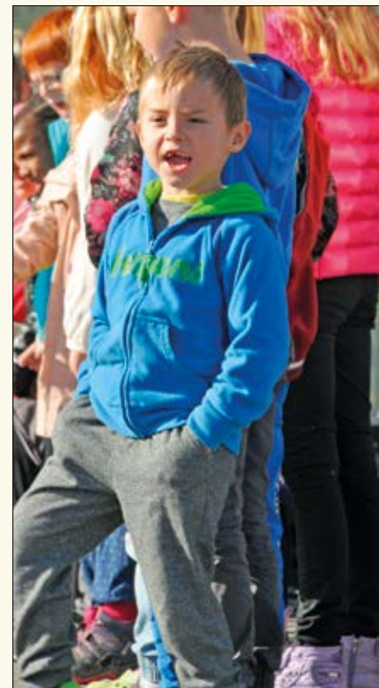
Mye innlevelse! Barn fra småskoletrinnet framførte, tradisjonen tro, Eplesangen av Jon Solberg.