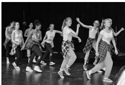
Ei dansegruppe fra Bø åpnet Solidaritetskonserten i Gullbring kulturanlegg fredag 2. oktober.

Kulturskolelærerne i Bø og Sauherad greide ikke å forholde seg passive til dette. De tok med seg venner og laget en Solidaritetskonsert i Gullbring Kulturanlegg fredag 2. oktober. Det ble en konsert med stor spennvidde, mange slags uttrykk, nykomponert musikk og 1600-tallsmusikk, jazz og viser, - og dans.